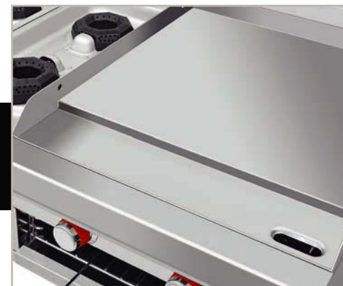
Plancha con exclusivo sistema para recolectar grasa y residuos.