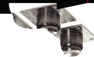
OPCIONAL: Base estructural o Kit de patas tubulares.