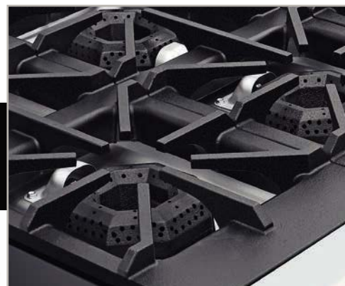
Robustas parrillas súper resistentes desmontables, facilitan la limpieza.