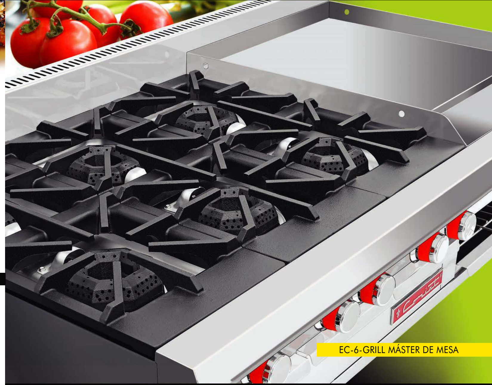
EC-6-GRILL MÁSTER DE MESA