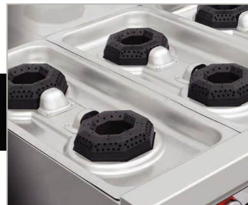
Cubierta semi-sellada, evita escurrimientos al interior.