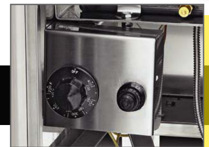
Mayor control y seguridad en el manejo de la freidora.