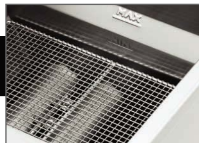
Parrilla para captar residuos.