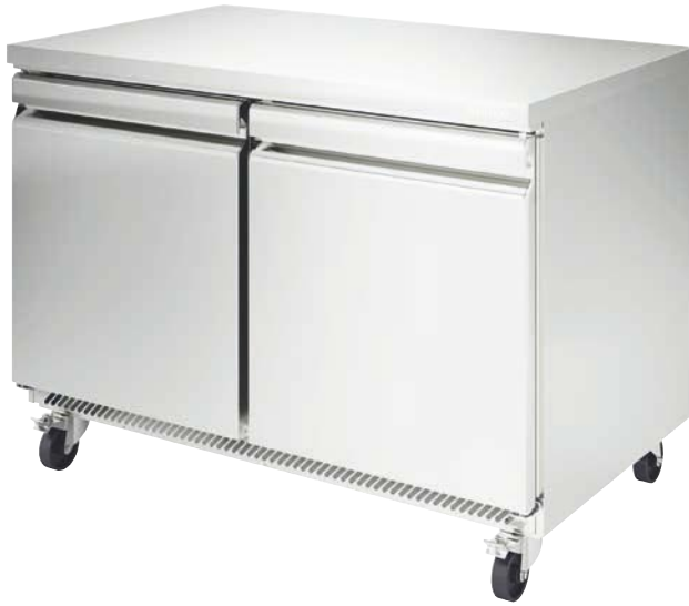
UC 48 R